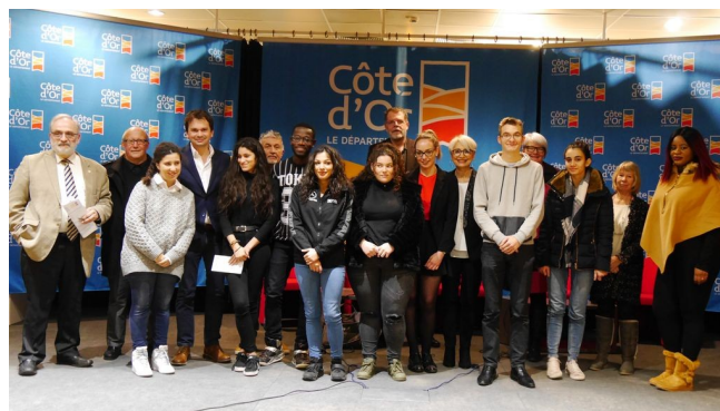
Remise des récompenses pour diplômés obtenus en 2017.